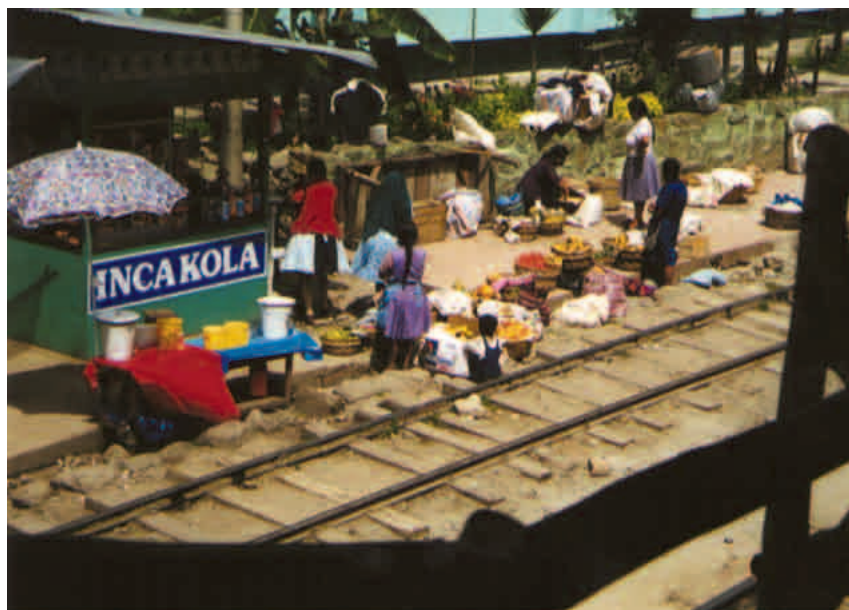
Figura 1 2

dos y quebrados que caen pronunciadamente hacia el río Urubamba. El único acceso histórico a esta sorprendente creación del imperio inca es a través de una cadena expuesta desde la Puerta del Sol (Intipunko), anteriormente el último control hasta Machu Picchu. Nuestro grupo paseó por Machu Picchu desde el amanecer hasta media tarde y después inició el descenso de la montaña para comenzar el viaje de vuelta hasta Cuzco y luego el retorno a casa, Australia y Nueva Zelanda.