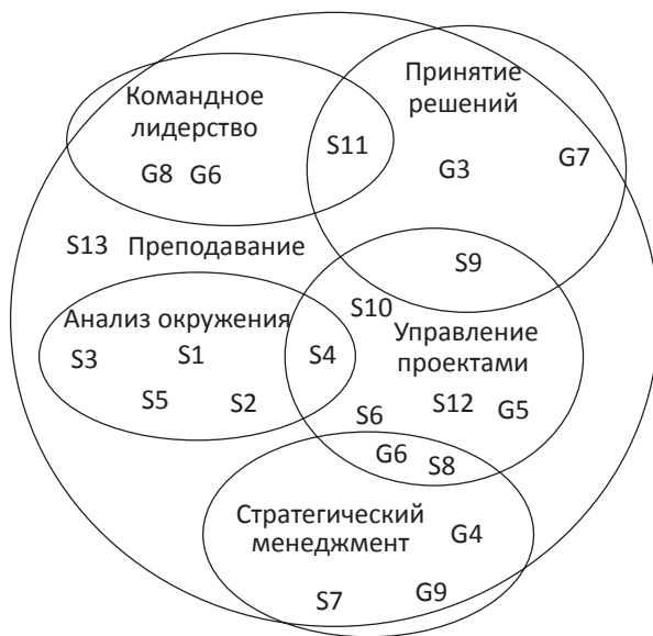
Рис. 2 Диаграмма метапрофайла